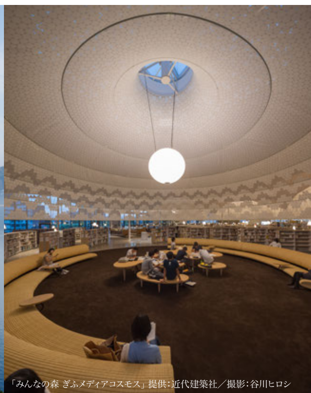
「みんなの森 ぎふメディアコスモス」