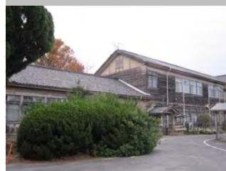
旧県立三木高等女学校舎