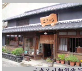
三寿の刃物製作所