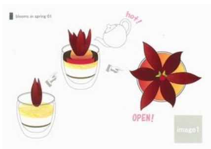
作品名 「blooms in spring」 デザイナー：Quintet Products. 上野 博久