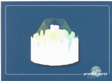
作品名 「Protect earth」 デザイナー：神戸芸術工科大学 大村 志帆