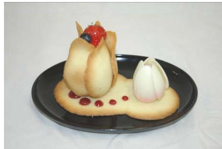
パティシエ：ベニール 栗尾 敦子