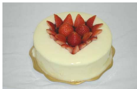
パティシエ：フーケ 稲葉 義弘