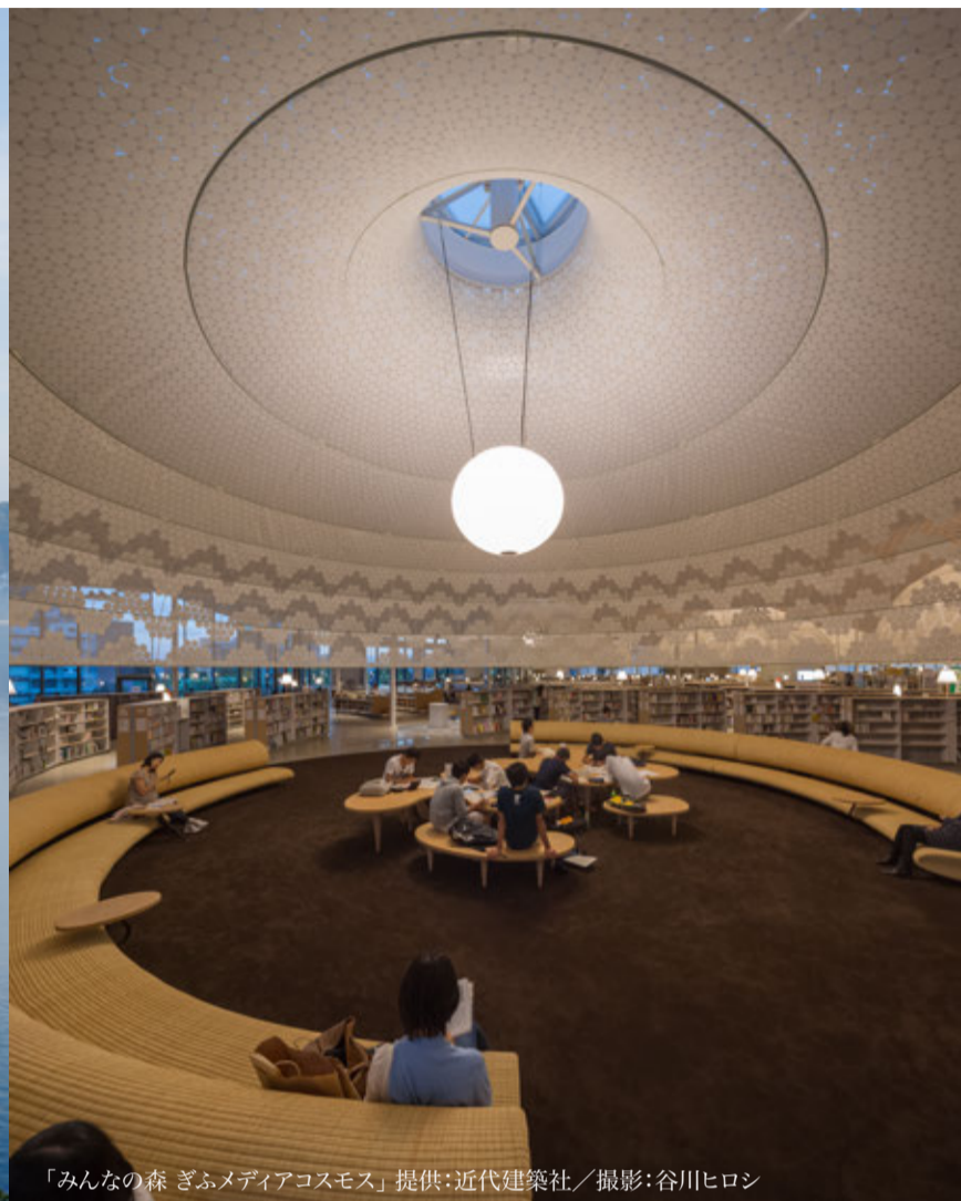
「みんなの森 ぎふメディアコスモス」