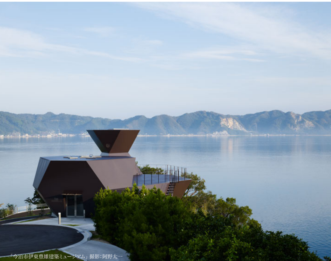
「今治市伊東豊雄建築ミュージアム」